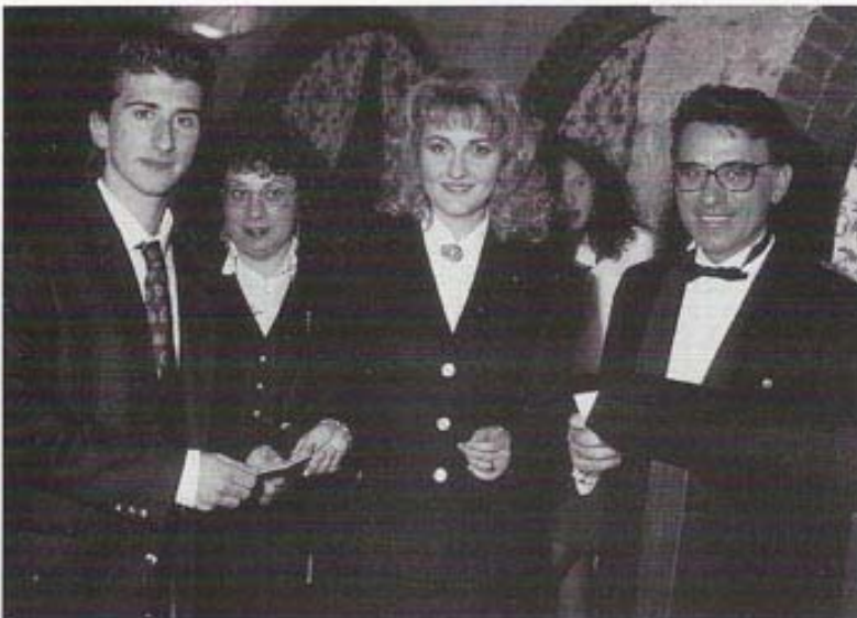
Consegna delle borse di studio ai vincitori del Concorso

ve va ricordata la realizzazione di una zona a verde prospiciente i giardini pubblici di levante con la messa a dimora di numerose palme. Venne consegnata al Comune di Augusta una targa con intitolazione del nuovo ponte di accesso alla città a Federico II di Svevia. Il "Premio Annuale Kiwanis" venne assegnato all'augustano Marcello Guagliardo in arte Marcello Giordani,