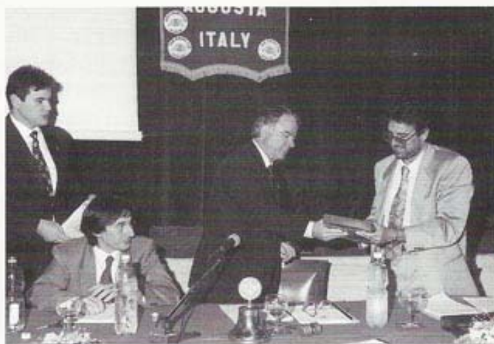
Conferenza sul Tema "La qualità della vita ad Augusta"