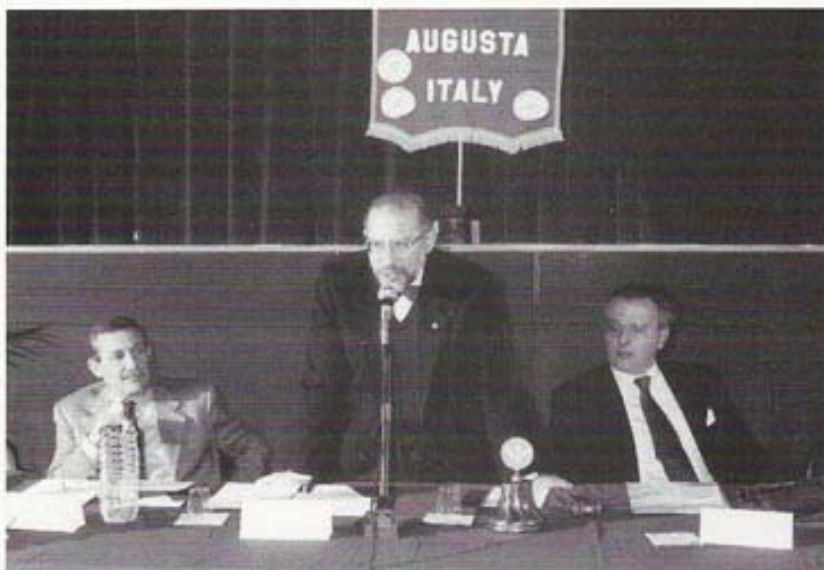
Convegno sul Tema " Usura - racket -mafia anelli della stessa catena"