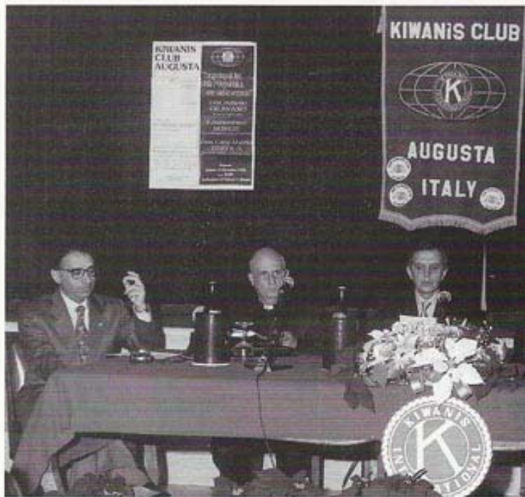
Conferenza su Tangentopoli