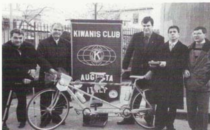
Consegna del Tandem da competizione

devoluti all'A.S. Nuova Augusta Sport Disabili, per l'acquisto di un tandem da competizione, poi consegnato nell'ottobre 1997.