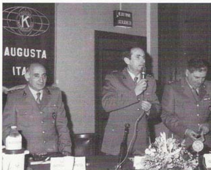
Conferenza - dibattito sul Tema "Il servizio militare di leva ed i criteri medico legali per l'idoneità"