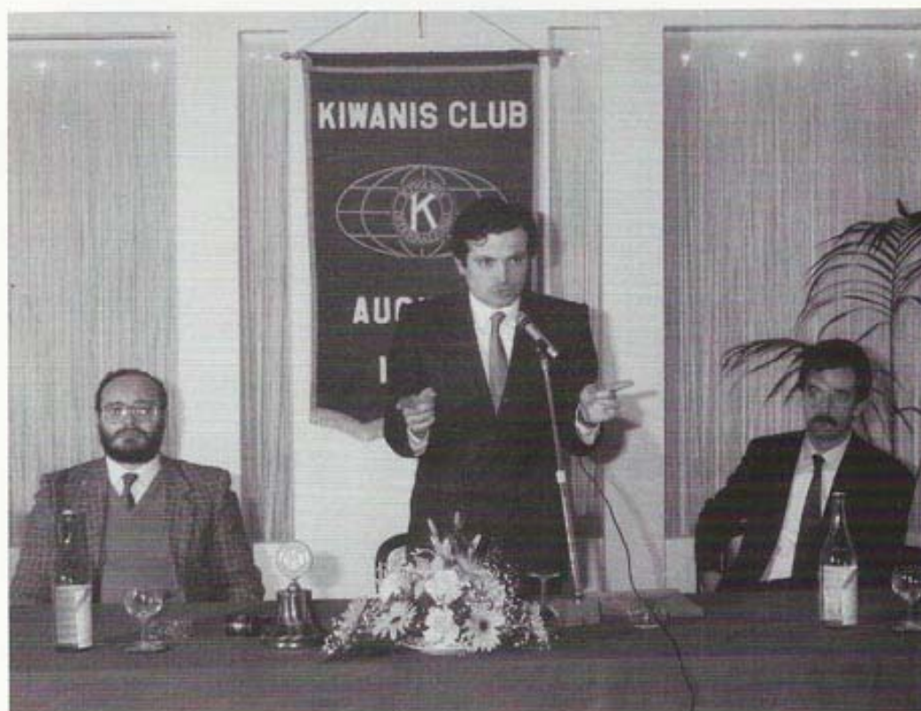
Conferenza sul Tema "L'Omeopatia come medicina alternativa"

Il 28 novembre 1986 si tenne un incontro a Palazzo San Biagio tra l'Assessore Regionale alla Sanità on. Sardo Infirri, l'on. Lo Curzio e gli operatori del settore sanitario cittadino sull'onda del ventilato accorpamento della locale USL ad altra struttura. Le ferme prese di posizione dell'uditorio ribadirono la volontà di mantenerne l'autonomia che, in seguito, restò in effetti tale. A metà dicembre del 1986 ad iniziativa del Club ed in collaborazione con la "Misericordia" vennero raccolti in due giorni in Piazza Castello 43 flaconi di plasma