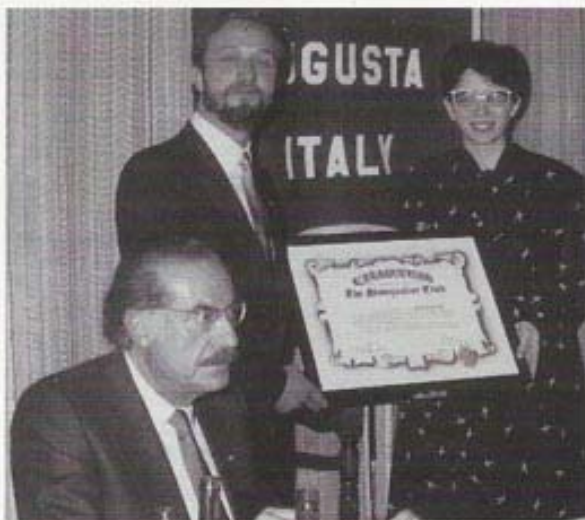
Consegna della Charter al Kiwajunior di Augusta