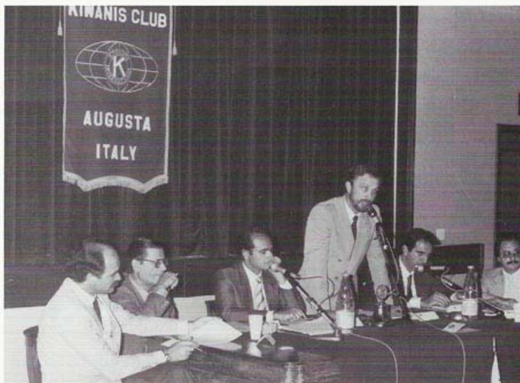
Convegno sul Tema "Crisi occupazionale"

Fu l'anno in cui il Club affrontò con vigore il tema della tutela e recupero di uno dei monumenti più importanti della Città il cui stato era già allora particolarmente allarmante: il Castello Svevo. Venne realizzata una cartolina raffigurante il Castello nel suo aspetto attuale, recante sul retro la dicitura "Salviamo il castello svevo"; le cartoline furono distribuite tra la cittadinanza ed inviate in numerose copie all'Assessorato Regionale ai Beni Culturali. Il 26.11.1983 venne organizzata a Palazzo San Biagio una Conferenza sul Tema "Il Castello Svevo di Augusta: ieri, oggi, domani". Insigne relatore dell'incontro fu il Prof. Santi Agnello, Ordinario di Archeologia Cristiana presso l'Università di Catania; intervennero i deputati regionali Leanza e Lo Curzio e l'arch. Antonio