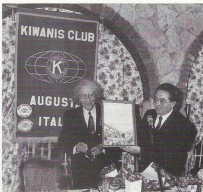
Conversazioni sul tema dei Presepe in Sicilia