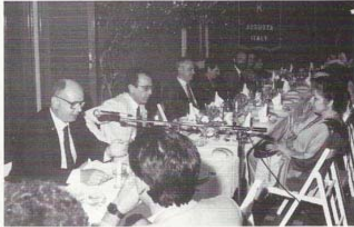
Conversazione sul Tema "Salvaguardia della vita umana in mare"