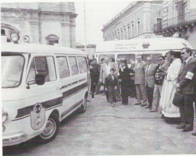
Benedizione di una nuova ambulanza della Misericordia di Augusta