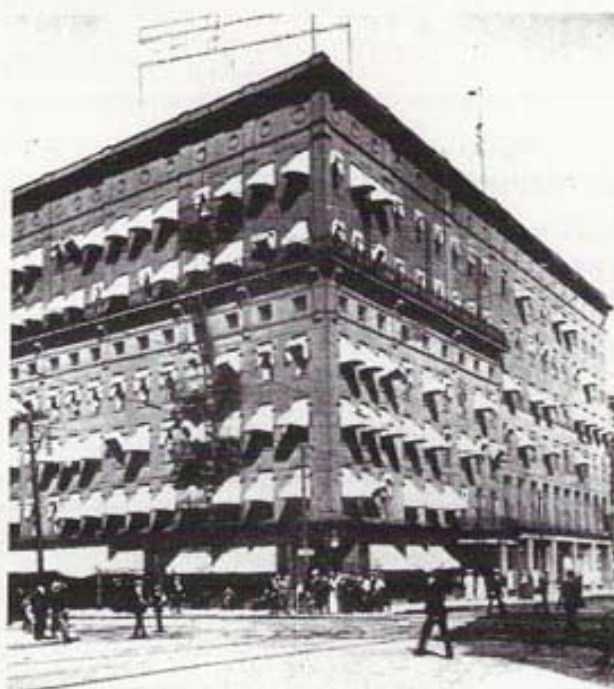
Detroit: Hotel Griswold, sede delle riunioni del primo Club Kiwanis