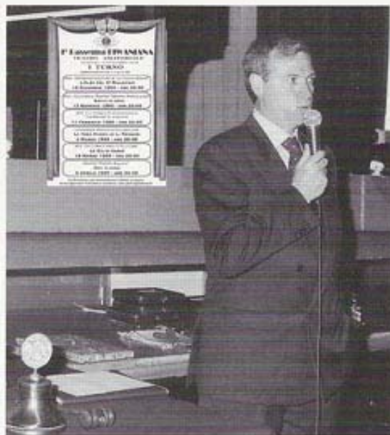
Presentazione della "I Rassegna del Teatro Amatoriale"