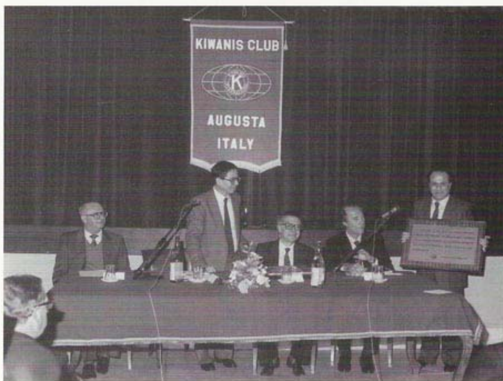
Conferenza sul Tema "Scienza e Società"