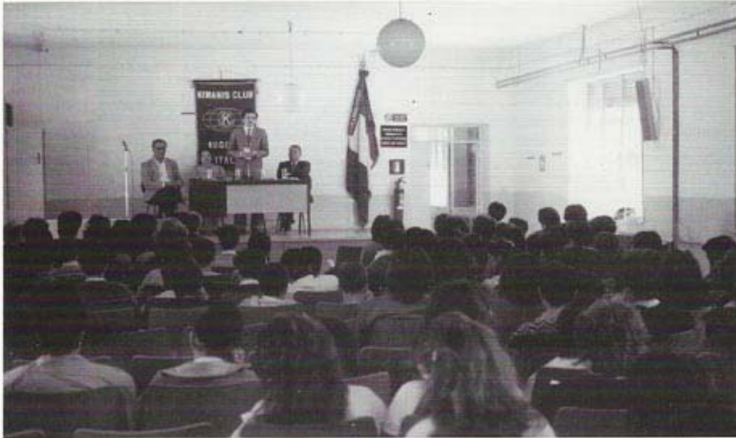
Conferenza a Melilli sul Tema "La Droga"

destinate ai piccoli thalassemicici di Augusta; una raccolta di fondi consentì al Club di donare alla Misericordia di Augusta un Emoglobinometro, apparecchiatura che consente al sanitario di valutare l'idoneità del donatore al salasso. Il Club, unitamente agli altri undici allora componenti la V Divisione Kiwanis, assegnò una borsa di studio per la ricerca effettuata ad un medico del Centro studi Thalassemicici di Catania.