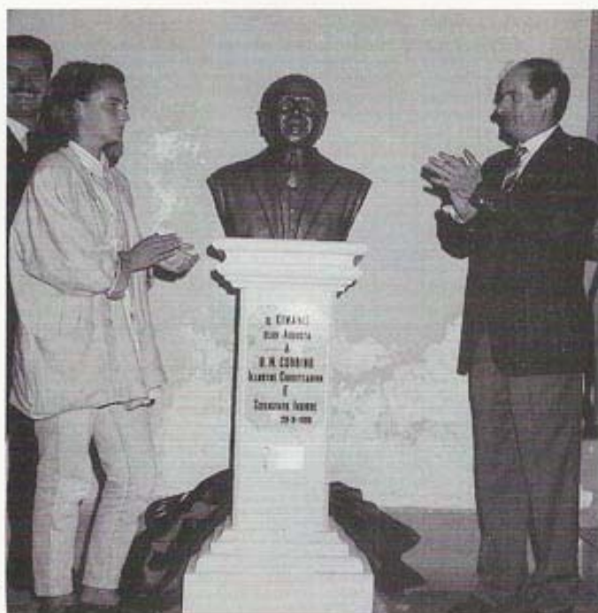
Scopertura del busto bronzeo dello scienziato Orso Mario Corbino