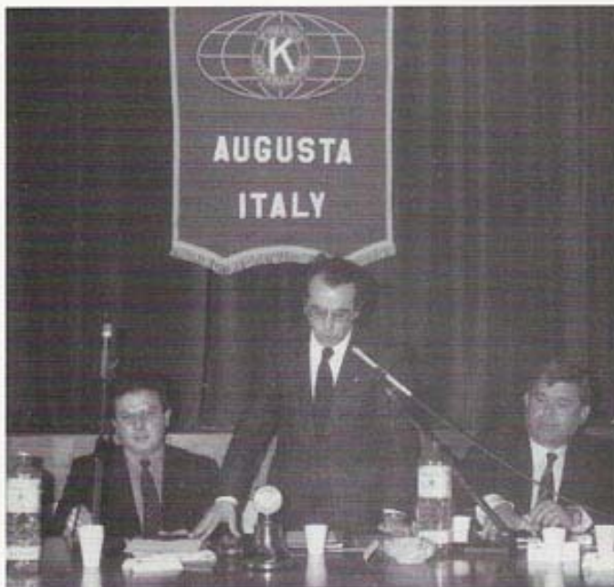
Conferenza sul Tema "Mediterraneo mare caldo"

Il "Riconoscimento Kiwanis" per l'anno 1986 venne assegnato, alla memoria, agli illustri fratelli augustani Prof. Orso Mario Corbino, Fisico e Prof. Epicarmo Corbino, Economista.