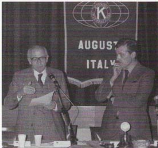
Convegno sul Tema "Il porto di Augusta come scalo commerciale"