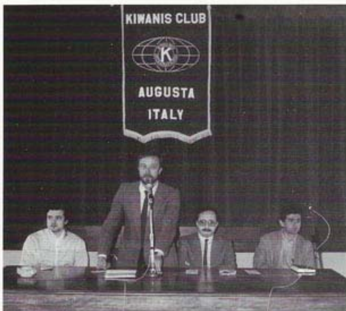
Convegno sul le problematiche della Droga