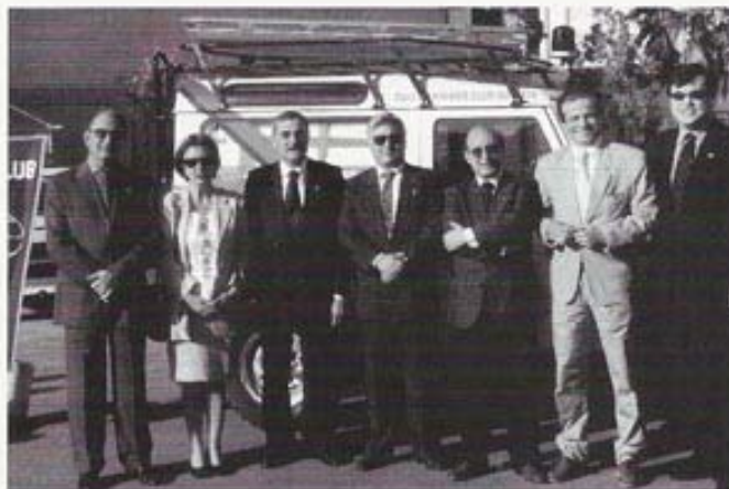
Consegna del Fuoristrada alla Misericordia di Augusta