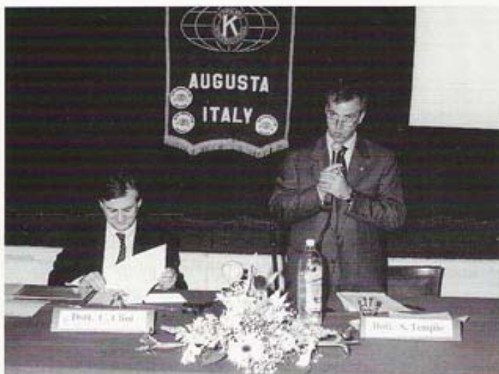
Conferenza sul Tema "Piano di risanamento ambientale"

tro Amatoriale con la rappresentazione "L'alba del 3° Millennio" di Pietro De Silva a cura de "La Nuova Scena" di Siracusa alla quale, nei mesi successivi, seguirono altre cinque compagnie. Scopi dell'iniziativa erano quelli di stimolare la crescita di tale settore culturale bisognoso di strutture adeguate; inoltre, rac-