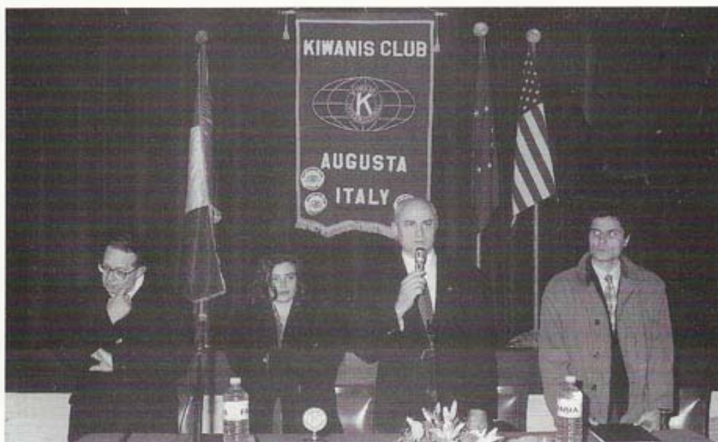
Conferenza sul Tema "Hangar di Augusta: Memorie e Proposte"