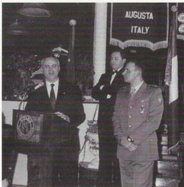
Consegna del Riconoscimento speciale per l'operazione "Vespri Siciliani"