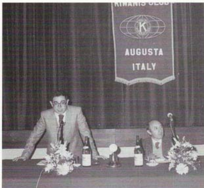
Conferenza dibattito: L'inquinamento del mare di Augusta

ziato; una targa-ricordo venne consegnata al Preside della Scuola Media "O.M. Corbino" di Augusta.