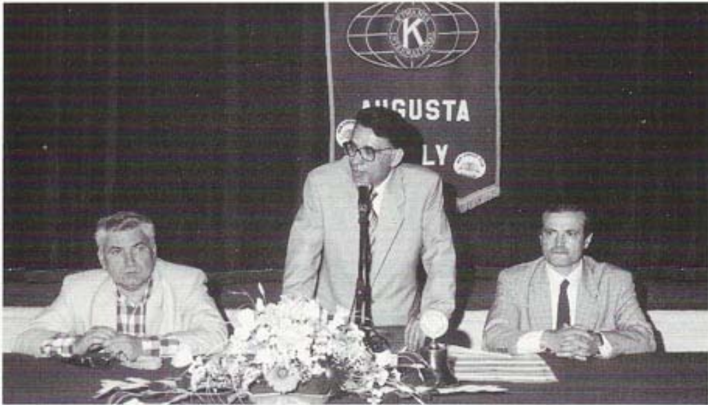
Intervento del Presidente in occasione del Concorso "Sette borse di studio a giovani Augustani"

ve va ricordata la realizzazione di una zona a verde prospiciente i giardini pubblici di levante con la messa a dimora di numerose palme. Venne consegnata al Comune di Augusta una targa con intitolazione del nuovo ponte di accesso alla città a Federico II di Svevia. Il "Premio Annuale Kiwanis" venne assegnato all'augustano Marcello Guagliardo in arte Marcello Giordani,