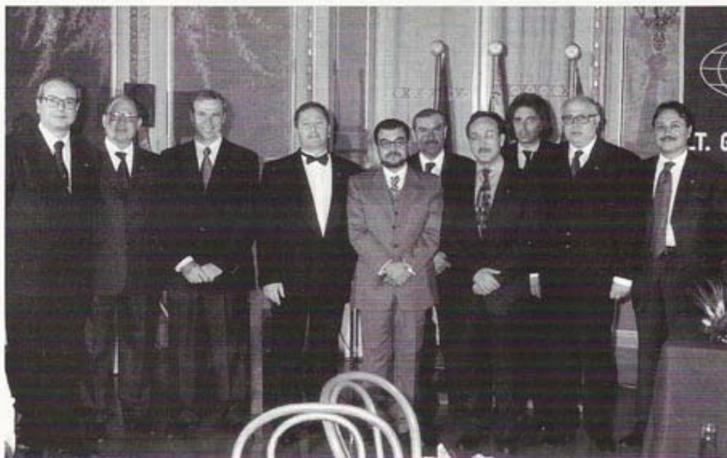
Il Direttivo dell'Anno Sociale 1999-2000