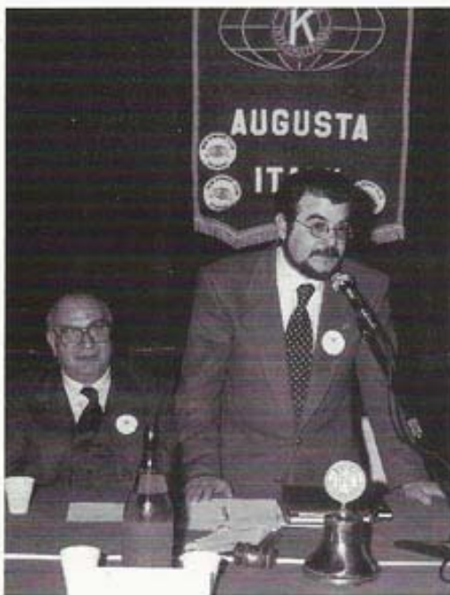
Conferenza sul Tema "Dialisi e Trapianti renali"

del mese della donazione del sangue avvenuta il 31 marzo 1996 nella Piazza Duomo di Augusta ha visto avvicinarsi presso l'autoemoteca della Misericordia numerosi cittadini per la donazione del proprio sangue. Particolare impegno è stato inoltre profuso per l'organizzazione della "2ª Rassegna Teatrale" con l'intenzione di stimolare la Municipalità a dotare la città di Augusta di un teatro che potesse essere "palestra di formazione culturale, centro di aggregazione sociale ma anche punto di partenza per una nuova educazione civica" e con l'obiettivo di costruire con i proventi degli abbonamenti un campo di bocce da donare agli anziani del Comune di Augusta. Il progetto, che ha avuto un lungo e travagliato iter per le relative autorizzazioni, è stato finalmente realizzato: la consegna del campo bocce sarà effettuata al Comune di Augusta entro il mese di marzo 2000.